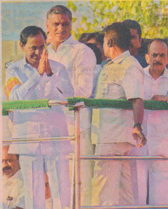
Chief Minister K. Chandrasekhar Rao acknowledges the cheers of the crowd as he is taken in a rally to the camp office from the Begumpet airport. Dy CM Md. Mahmood Ali and minister T. Harish Rao are also seen.

It will also oversee agreements with undivided AP, set up officials' team to inspect projects in the state.